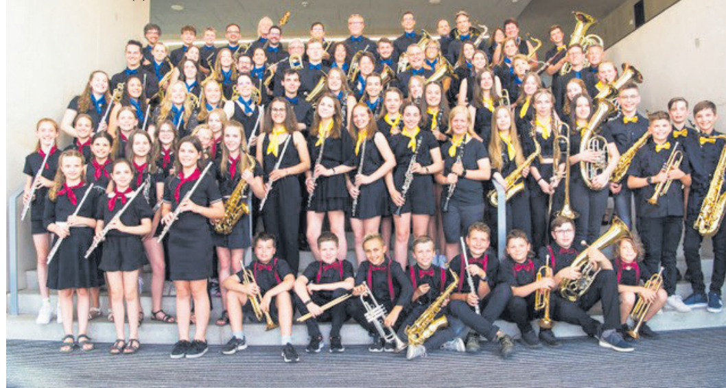
Fördert den Nachwuchs: Die Bläusersinfonie Berg