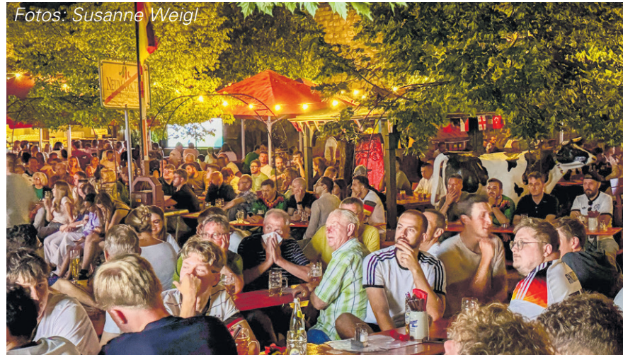
Eine lange Nacht, die mit langen Gesichtern endete...