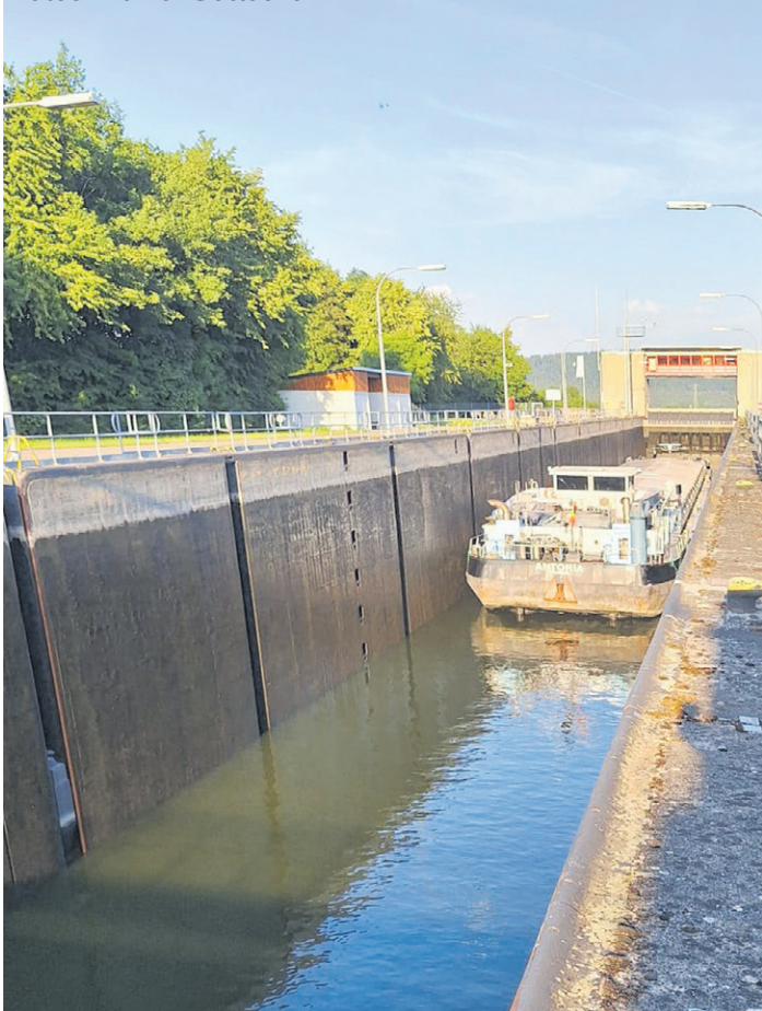
Der "Aufzug" für Schiffe: Die Schleuse in Dietfurt