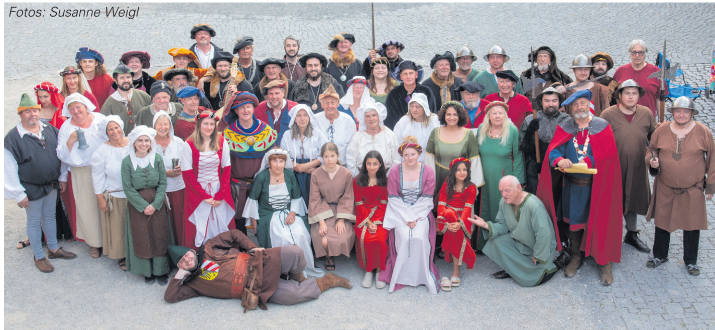
Das Ensemble der Epelein-Festspiele Burgthann