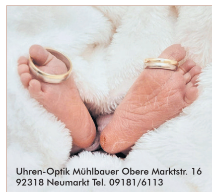
Uhren-Optik Mühlbauer Obere Marktstr. 16 92318 Neumarkt Tel. 09181/6113

Das Online-Portal Pinterest, welches inspirierende Bilder zu verschiedenen Lebensbereichen bietet, analysiert jedes Jahr, wonach seine Nutzer gesucht haben. Im vergangenen Jahr wurden weltweit über 7 Milliarden hochzeitsbezogene Suchanfragen verzeichnet und mehr als 16,7 Milliarden Hochzeitsinspirationen gespeichert. Ein paar der auffälligen Trends: Verlobungsfotos , die nicht formell im Stu-