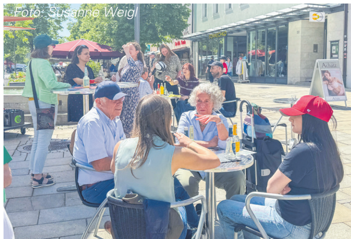
„Speed Dating“ unter freiem Himmel.