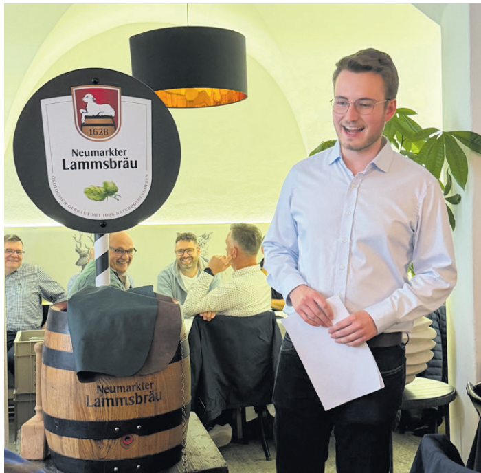
Bierprobe im Restaurant St. Franziskus