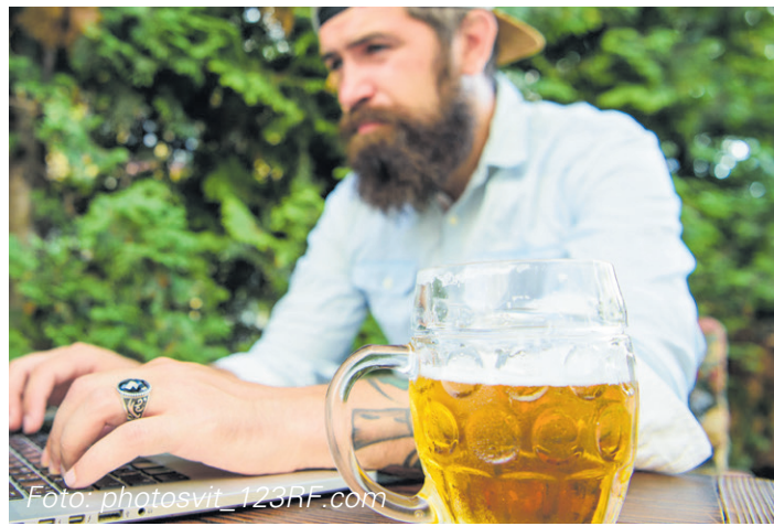
Laptop und Biergarten vertragen sich nur bedingt.

Der Biergarten als analoges Paradies in einer digitalisierten Welt