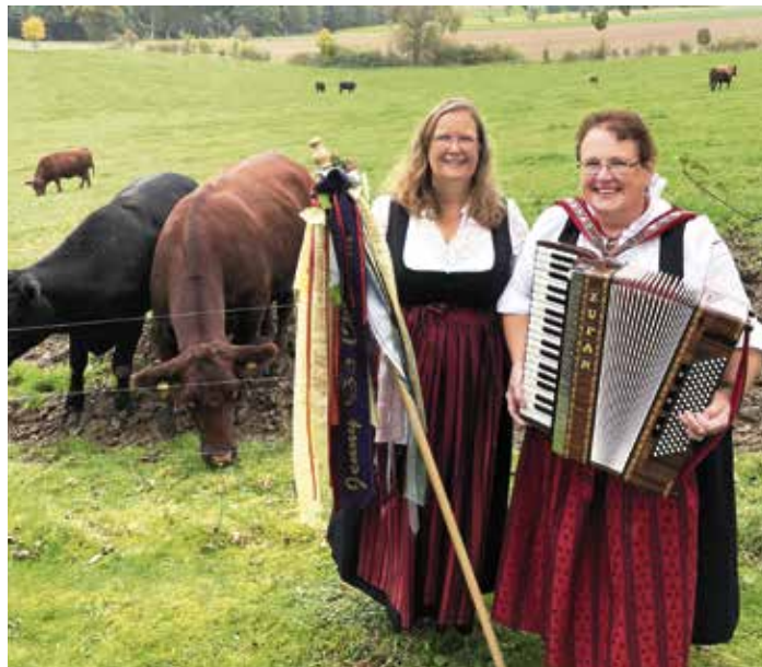
Das „Berger Duo“