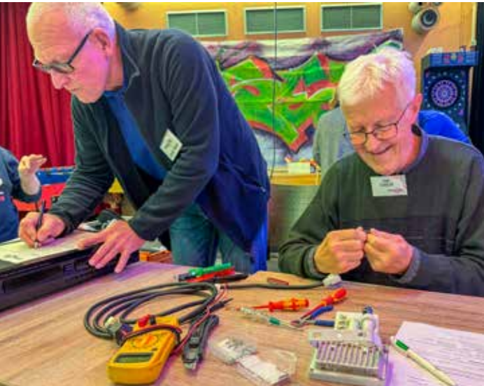
Defektes wird im Repair Café genau unter die Lupe genommen.