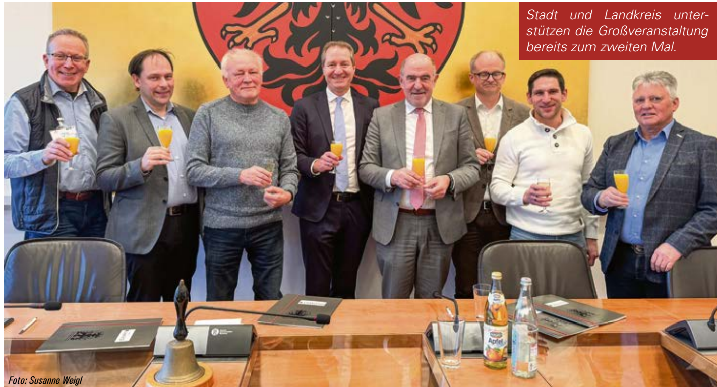
Stadt und Landkreis unterstützen die Großveranstaltung bereits zum zweiten Mal.