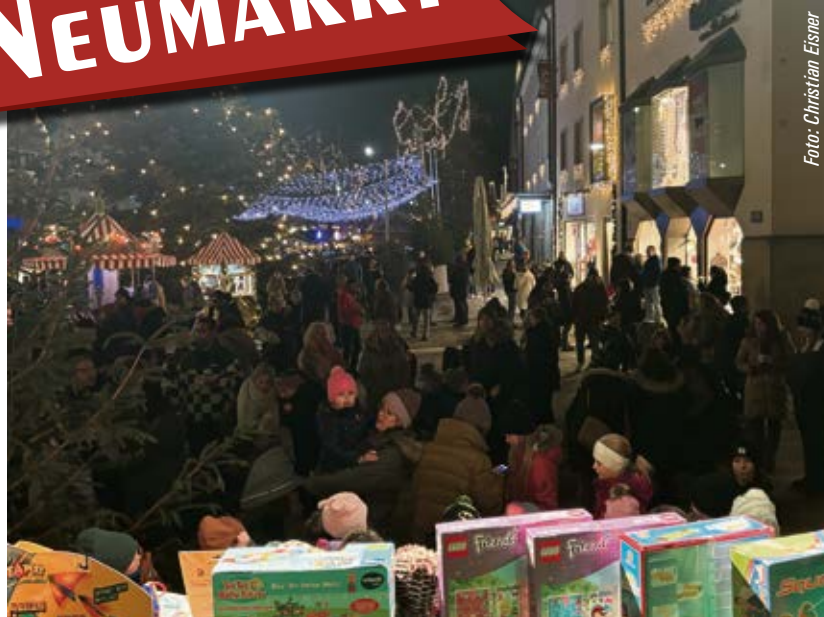
Bei Jung und Alt sehr beliebt waren die vier Tombolas auf dem Neumarkter Weihnachtsmarkt.

FREYSTADT Am 8. März 2024 findet von 19 bis 21 Uhr zum 16. Mal ein Nachtbasar in der Mehrzweckhalle statt. Verkauft werden können Baby-, Kinder- und Jugendbekleidung für Frühling/Sommer, Spielsachen, Puzzle, Bücher, Babyausstattung, Fahrräder, Laufräder u.v.m. Verkäufer können sich ab 26. Januar 2024 per E-Mail unter: info@kinderfreyzeit.de anmelden. Mehr Infos unter www.kinderfreyzeit.de/basar